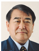
寺島 実郎 Jitsuro TERASHIMA