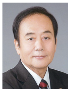
上田 清司氏 Kiyoshi UEDA